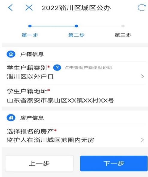
图 7 城区填报

5. 完善房产信息（如图 7-8）。城区范围内无合法房产的外来务工人员报名房产选择“监护人在淄川城区范围内无房”；报名乡镇范围内无合法房产的外来务工人员报名房产选择“学校招生范围内无房”。