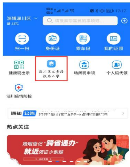
图1 “爱山东”APP 首页

1. 进入“爱山东”APP，在首页点击【淄川区义务段报名入学】栏目，进入入学信息填报界面。