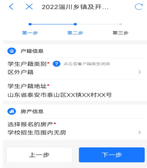
图 6 乡镇及开发区填报

5. 完善房产信息（如图 7-8）。城区范围内无合法房产的外来务工人员报名房产选择“监护人在淄川城区范围内无房”；报名乡镇范围内无合法房产的外来务工人员报名房产选择“学校招生范围内无房”。