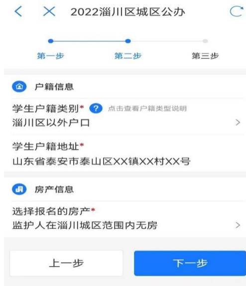
图 5 城区填报