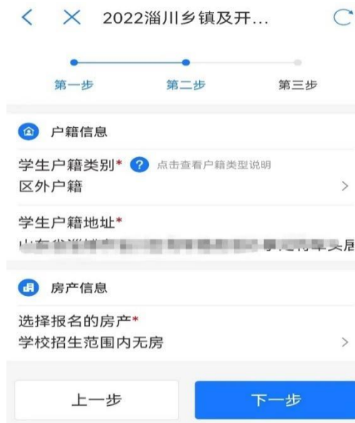
图 8 乡镇及开发区填报

6. 获取居住证信息，完善工作信息（如图 9）。平台数据接口自动获取监护人居住证信息，由监护人根据实际选择务工或自主经营，相关信息将