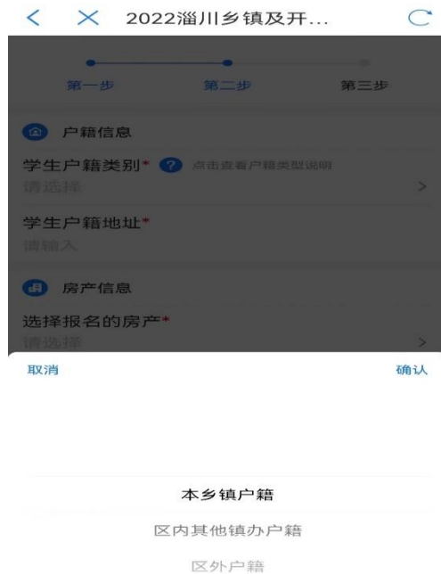
图 6 乡镇及开发区填报

5. 完善房产信息(如图 7)。监护人在学校招生范围内有合法房产且已办理产权证的,可从房产信息列表中选择报名所用房产;暂未办理不动产证但已交工入住的新建小区合法房产的,请手动输入网签合同编号(20位由数字及大写英文字母组成的字符串),获取房产信息。