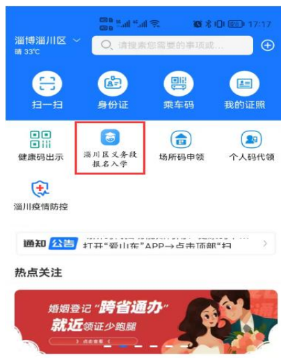
图1 “爱山东”APP 首页

1. 进入“爱山东”APP，在首页点击【淄川区义务段报名入学】栏目，进入入学信息填报界面。