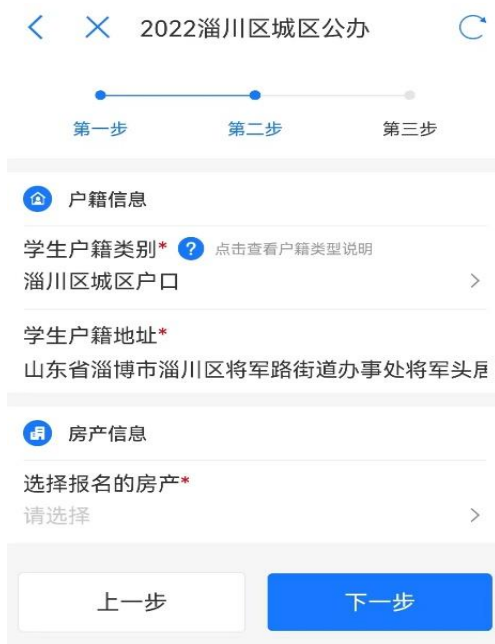
图 5 城区填报