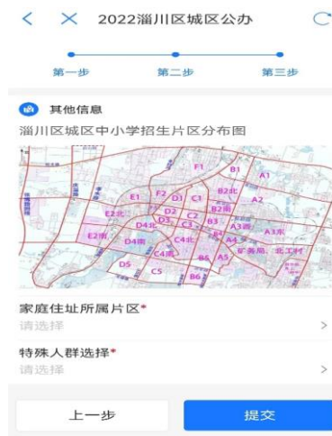
图 8 城区片区选择

6. 填报片区信息 (如图 8-9)。监护人根据家庭住址, 参考片区分布图 (点击图片可放大查看), 准确选择家庭住址所属片区。城区幼升小入学信息填报中, 对于符合城区小学入学条件且计划选择到雁阳小学就读的适龄儿童, 可在所属片区中直接选择“拟选择雁阳小学就读”。根据实际情况选择是否为相关类别的特殊人群后提交即完成所有报名流程。