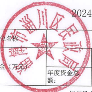
2024年度市级彩票公益金绩效目标自评表