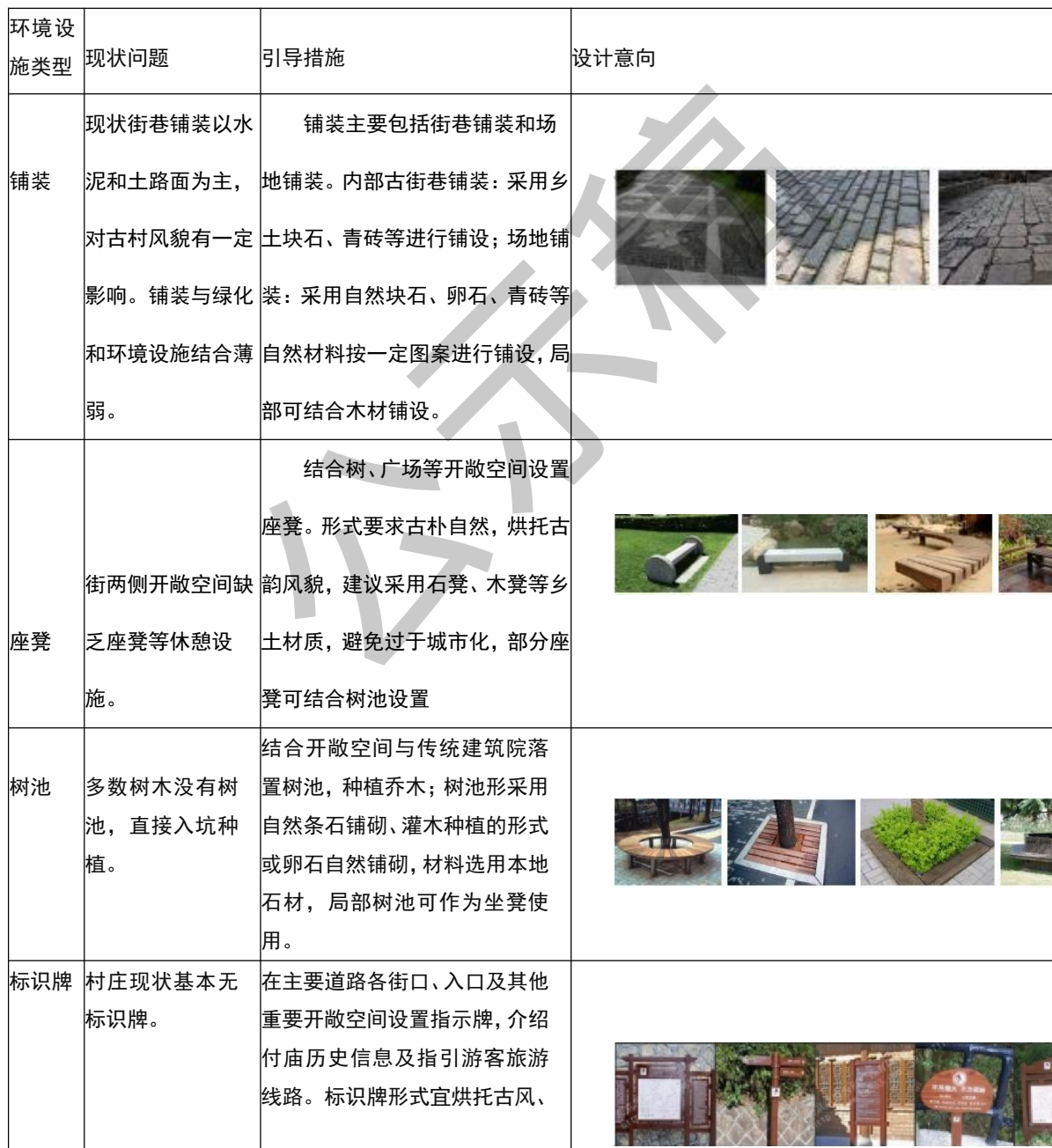
表 6-1 景观小品规划一览表